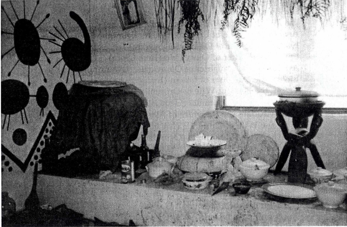
Ogbeyonu Temple Osogbo, 1983