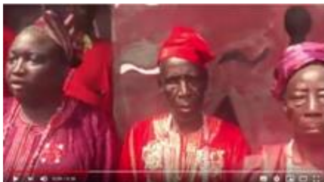
Vídeo no Youtube com a fala dos anciões de Oyó.